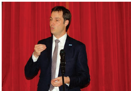
M. Alexander De Croo, Vice-Premier Ministre